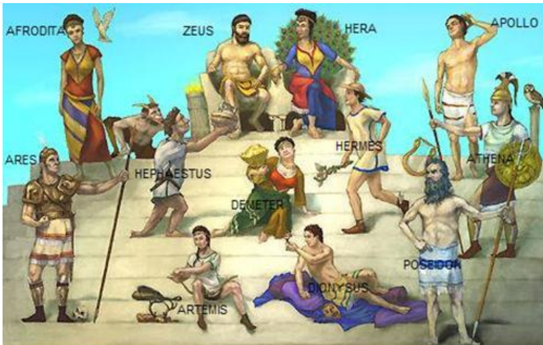
Slika 2: Bogovi Starih Grkov