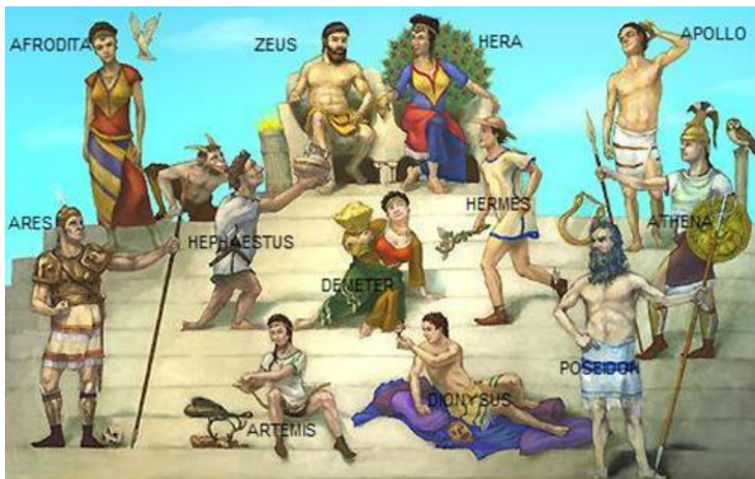
Slika 2: Bogovi Starih Grkov