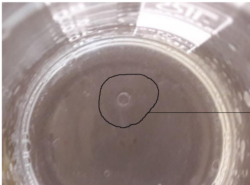
Prva kapljica eteričnega olja

Po uri čakanja na prvo kapljico eteričnega olja, smo jo le dočakale. Laboratorij in hodniki šole so bili odišavljeni z eteričnim oljem sivke, ki je prevladoval nad vonjem po žajblju.